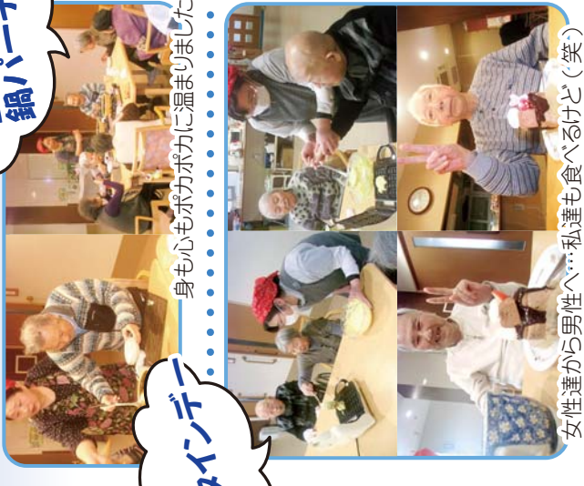
バレンタインデー