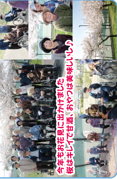
今年もお花見に出かけました 桜はキレイで甘酒、おやつは美味しい!