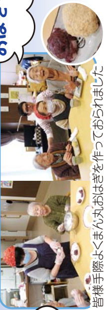
皆様手際よくまん丸おはぎを作っておられました